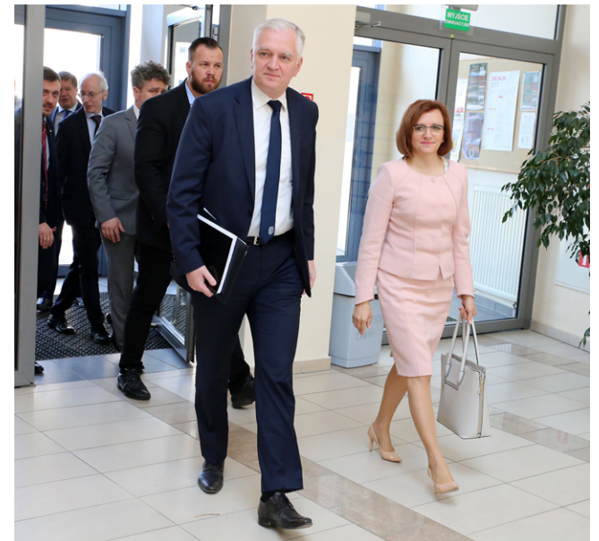
Wojewoda wraz z wicepremierem na kieleckim uniwersytecie.

Podczas swego wystąpienia wicepremier mówił o doskonałości naukowej w strategii rozwoju Ministerstwa Nauki i Szkolnictwa Wyższego. - Kielce ma bardzo dobrą i świadomą strategię, która wpisuje się w priorytety minister-