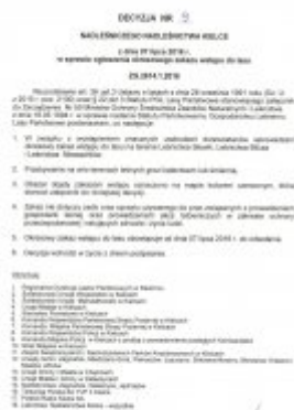
DECYZJA NR 9 NADLEŚNICZEGO NADLEŚNICTWA KIELCE z dnia 07 lipca 2016 r. w sprawie ogłoszenia okresowego zakazu wstępu do lasu