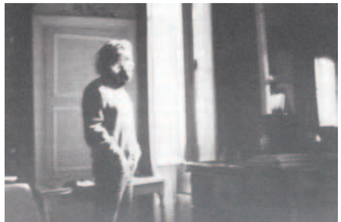
Fotografia Jima Morrisona z 1971r., przy oknie sypialni mieszkania, w którym zmarł.