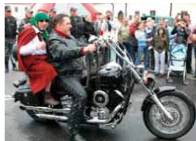
Genowefa Pigwa w wersji dla zmotoryzowanych