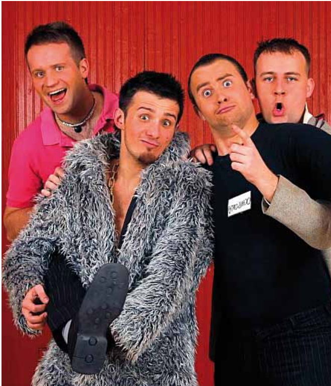
Kabaret Skeczów Mężących

Tyle klasyki, czas świeży powiew młodości. Niewątpliwie największe sukcesy święci teraz w całym kraju