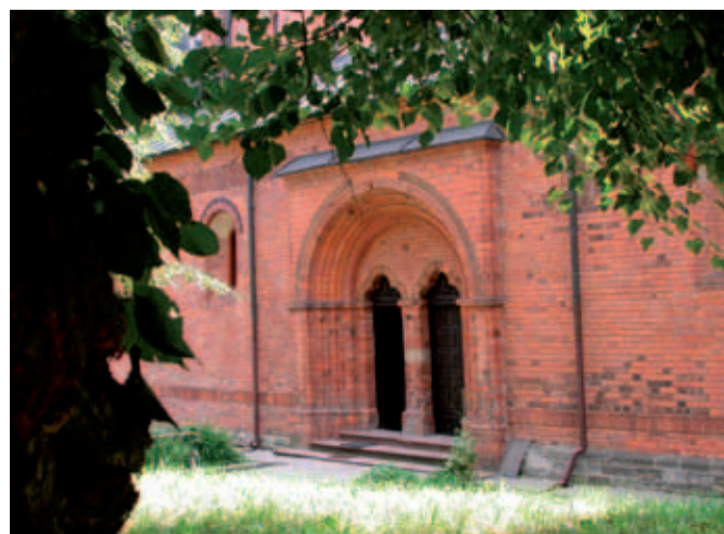
Portal kościoła Św. Jakuba

dwigi, romantycznym, kilkusetmetrowym głębokim lesowym jarem. Jego zbocza porastają ogromne wiązy, kłony i lipy, których korzenie tworzą na ścianach niezwykłą płataninę. Zachwycając się sandomierską przyrodą, nie można pominąć Gór Pieprzowych po drugiej stronie Wisły. Na terenie utworzonego z kambryjskich łupków rezerwatu przyrody występują murawy kserotermiczne i wielka liczba dzikich róż. Rozległy widok na zakręt Wisły rozlega się z trójgraniastego Wzgórza Salve Regina usytuowanego w południowo-zachodniej części miasta.