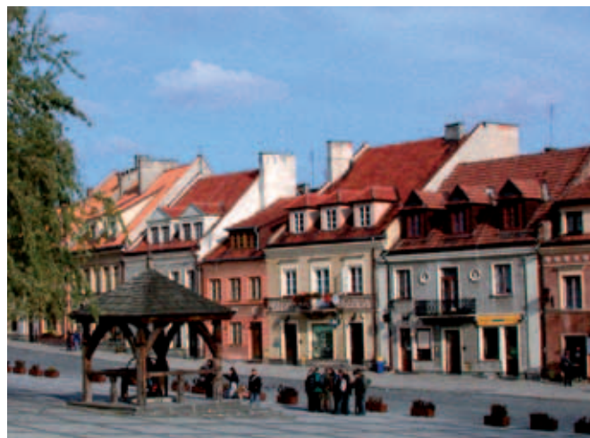
Kamienice na rynku

Gdy już o atrakcjach kulturalnych miasta mowa... Co roku odbywają się w Sandomierzu Jarmark Jagielloński oraz Międzynarodowy Turniej Rycerski o Miecz Zawiszy Czarnego. Podziwiać wówczas można m.in. sztukę rycerskiej braci z Chorągwi Rycerstwa Ziemi Sandomierskiej, jednej z najlepszych w kraju grup zajmujących się rekonstrukcjami historycznymi. Nota bene pokazy sandomierskich rycerzy można oglądać na rynku w każdą sobotę i niedzielę w sezonie turystycznym. Melomanów radują „Sandomierskie Wieczory Organowe” - wakacyj-