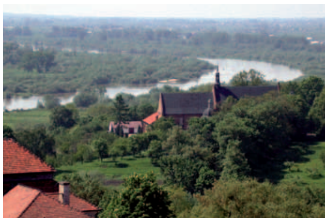
Kościół św. Jakuba-widok z Bramy Opatowskiej

„Kiedy mówimy słowo: Polska, to w naszej świadomości nie jawi się mapa geograficzna. Wymawiając je tutaj, nad środkową Wisłą, nie myślimy o piaszczystych wybrzeżach Półwyspu Helskiego czy pięknym parku bukowym na wyspie Wolin. Słowo Polska tu – to krajobraz sandomierski: Góry Pieprzowe, dolina Wisły, widok, jaki oglądamy z okien zamku sandomierskiego, spoglądając w stronę kościoła św. Jakuba. Obrazy te kojarzą się z naszym domem, z najbliższym nam miejscem, wywołują poczucie bezpieczeństwa i zakorzenienia w przestrzeni naszej małej Ojczyzny, która stanowi dla nas synonim polskości”. Tak jawi