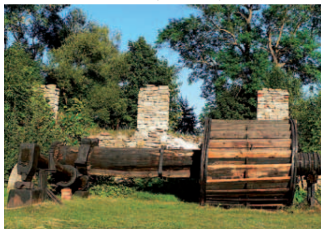
Koło wodne z młotem - eksponat w Muzeum Zagłębia Staropolskiego w Sielpi Wielkiej

jesienią, bowiem ten okres sprzyja dodatkowym atrakcjom. Zatem koniecznie sprawdźmy przed wyjazdem, gdzie i kiedy możemy trafić np. na rycerski turniej na dziedzińcu zamku, rekonstrukcję oblężenia czy może jarmark nawiązujący atmosferą do wieków średnich. Grzechem byłoby opuścić coroczny, lipcowy Międzynarodowy Turniej Rycerski o Miecz Zawiszy Czarnego z Garbowa, który odbywa się podczas Jarmarku Jagiellońskiego w Sandomierzu. W jednej chwili możemy przenieść się w czasy łuczniczych turniejów, konkursów strzelania z kuszy, walk piechoty na miecze i topory, artystycznych pojedynków bardów i tancerzy, „żywych szachów”. Dzieło wieńczy bal dworski z paradą dworu Księstwa Sandomierskiego i chorągwi wojsk sando-