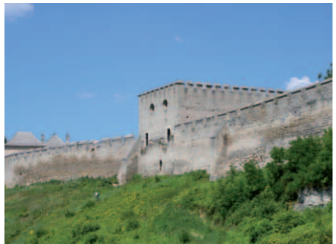
Szydłów - „polskie Carcassonne”

I tak można by mnożyć miejsca na naszej rowerowej mapie, gdzie warto spędzić więcej czasu, wy-