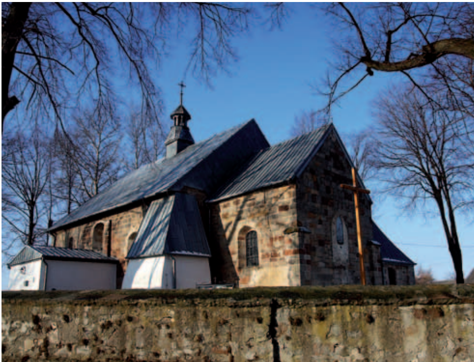
Romańska bryła kościoła św. Idziego w Tarczku z daleka już przykuwa wzrok rowerowych turystów

tradycyjnymi potyczkami najbardziej atrakcyjnie przedstawia się szturm na zamek, jedyną budowlę w naszym województwie, w której zachowały się średniowieczne fortyfikacje. Koniec września to obowiązkowa wizyta w Rytwianach – również na naszej rowerowej mapie. Ufundowana w 1624 roku Pustelnia Złotego Lasu przywita zmęczonych turystów ciszą, spokojem, dziewiczą przyrodą. Tutaj właśnie można odpocząć między kolejnym dniem rowerowej podróży. Dobrze wtedy zregenerować siły specyfikami z Leśnej Apteki. Coroczny kiermasz na terenie Pustelni oferuje naturalne produkty lecznicze: miody, wyroby pszczelarskie, mieszanki ziół, herbat, ale także wyrabiane na podstawie tradycyjnych receptur nalewki czy przetwory z owoców leśnych. To tylko niektóre z letnich propozycji miejsc na szlaku architektury obronnej.