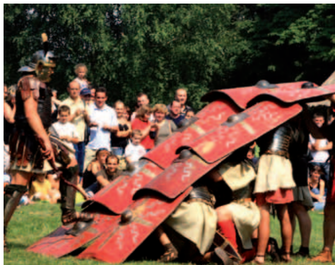
Podczas dymarek rzymscy legioniści prezentują musztrę wojskową

Jeśli stanęliście przed problemem z zaplanowaniem 10 wolnych dni, nic nie stoi na przeszkodzie, żebyście urządzili sobie rowerowy szturm na zamki „Szlakiem Architektury Obronnej”. Łącznie ponad 500 kilometrów, więc zabawy mnóstwo! Oczywiście nic nie stoi na przeszkodzie wybrać sobie dowolny odcinek szlaku, jednak wyjeżdżając z Kielc, przez Bodzentyn, Ćmielów, Opatów, Sandomierz, Ujazd, Szydłów, Wiślicę, Sobków, Chęciny, Kazanów, na Końskich kończąc będziemy mogli poszczycić się „zdobyciem” niemal czterdziestu obronnych budowli, bądź ich ruin. Administratorzy znajdujących się na szlaku miejsc postarali się i przygotowali specjalne miejsca, w których każdy może zostawić po sobie „pamiątkę” - czy to pod postacią imienia, nazwiska czy oryginalnego symbolu. Warto wybrać się na taką wycieczkę w porze letniej czy wczesną