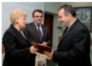
Spotkanie z darczyńcami

Wśród zaakceptowanych projektów znalazły się między innymi: przebudowa i budowa dróg (26 mln zł), budowa mieszkań socjalnych (7,2 mln zł), budowa przedszkola (5,5 mln), jak również inwestycje o charakterze środowiskowym (wodociągi) z dofinansowaniem w kwocie ponad 2,5 mln zł.