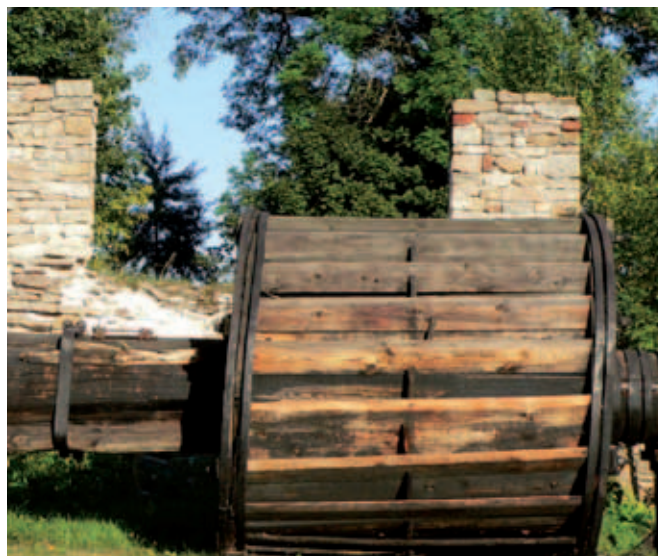
Ekspонат w Muzeum Zagłębia Staropolskiego

Unikatem wśród polskich muzeów jest Państwowe Muzeum im. Przypkowskich w Jędrzejowie posiadające bogatą kolekcję różnych typów zegarów pochodzących z okresu XVI-XX wieku, m.in. mechanicznych, słonecznych i wodnych oraz przyrządów astronomicznych.