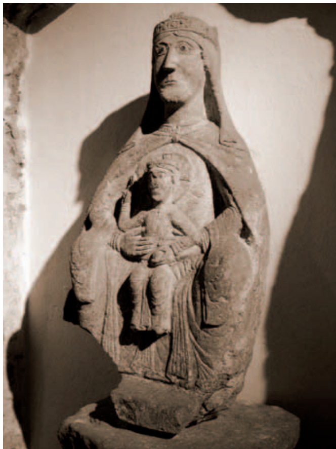
XIII-wieczna Madonna z Goźlic ze zbiorów sandomierskiego Muzeum Diecezjalnego

skarbem polskiego dziedzictwa kulturowego - choćby na słynną wiślicką „płytę orantów”. Oddzielną muzealną kartę stanowi Sandomierz. Sama miejska starówka jest tu swoistym „muzeum” pod gołym niebem. Jednakże każdego odwiedzającego to nadwiślańskie miasto zachwycą zbiory Muzeum Regionalnego mieszczącego się w dawnym kazimierzowskim zamku oraz wspaniałe eksponaty prezentowane w późnogotyckim Domu Długosza, gdzie swą siedzibę znalazło Muzeum Diecezjalne. Wśród skarbów tego muzeum znajduje się XIII-wieczna kamienna rzeźba Madonny z Goźlic, XVI-wieczny obraz „Św. Anna Samotrzeć” czy „Matka Boska z Dzieciątkiem i św. Katarzyna” Łukasza Cranacha Starszego.