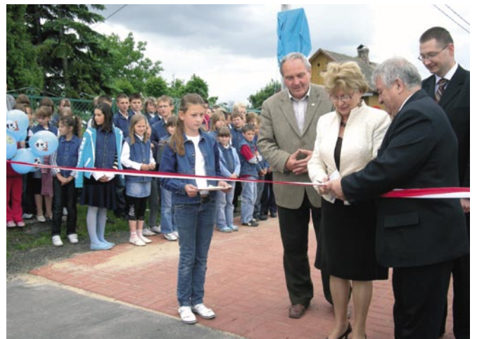
Kolejna „schetyńówka” otwarta

Zgodnie z przyjętymi zasadami, gminy i powiaty będą mogły starać się o dofinansowanie na przyszły rok w wysokości do 50 proc. kosztów inwestycji. Na jeden projekt będzie można otrzymać maksymalnie 3 mln zł dotacji. Przy czym powiaty będą mogły zgłosić maksymalnie dwa projekty w roku, a gminy tylko jeden. Województwo świętokrzyskie w 2010 r. ma do dyspozycji na ten cel 52.540 tys. zł.