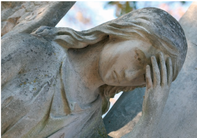
Zaduszki to także czas zadumy i refleksji

To święto opiera się na przekonaniu, że dusze wiernych, którzy przed śmiercią nie zostali oczyszczeni z grzechów powszednich