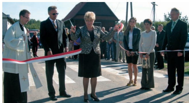
Kolejna „schetynówka” otwarta

Ogółem wpłynęło 108 wniosków na kwotę 111 723,2 tys. zł, w tym 26 wniosków z powiatów na kwotę 49 221,9 tys. zł oraz 82 wnioski z gmin na kwotę 62 501,3 tys. zł. Na podstawie uchwały Rady Ministrów nr 157/2009 z dnia 15 września 2009 województwo świętokrzyskie otrzymało do dyspozycji 52 540 tys. zł. Na podstawie merytorycznej oceny dokonanej przez komisję, wojewoda rekomenduje do zatwierdzenia przez Ministra Spraw Wewnętrznych i Administracji 17 wniosków z powiatów na kwotę 26 270 tys. zł oraz 20 wniosków z gmin na kwotę 26 270 tys. zł. Wnioski ponad limit nie były rozpatrywane przez komisję i zostały odesłane do wnioskodawców.