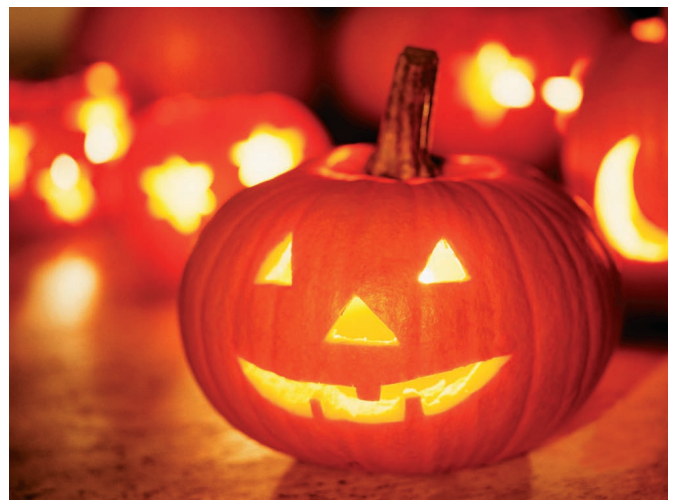
Jednym z symboli Halloween są wydrążone dynie

Ze święta Samhain wywodzi się z kolei tradycja Halloween, ostatnio coraz bardziej popularna także i w naszym kraju. Zwyczaj ten sprowadzili do Ameryki Północnej w XIX wieku irlandzcy imigranci, a w połowie XX wieku święto trafiło do zachodniej Europy. Halloween, kojarzony z przebierańcami i wydrążonymi dyniami, najhuczniej obchodzi się w Stanach Zjednoczonych, Kanadzie, Szkocji, Anglii i oczywiście Irlandii, gdzie jest świętem państwowym.