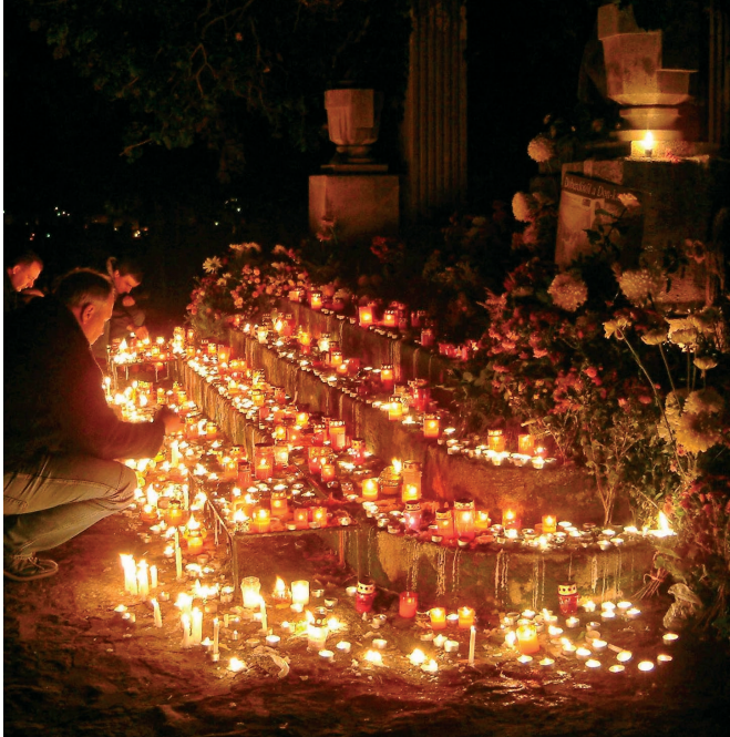
Znicze na mogiłach są symbolem pamięci o zmarłych

nie mogą oglądać majestatu Boga, ale można im pomóc przez modlitwę i ofiarowanie mszy. Tegoż zadusznego dnia odwiedzamy na cmentarzach groby zmarłych bliskich, przyjaciół i znajomych oraz wspominamy wszystkich, którzy odeszli z tego świata. W kościołach odprawiane są msze za zmarłych, a symbolem pamięci o nich jest tradycja zapalania na mogiłach zniczy i świeczek oraz składania kwiatów.