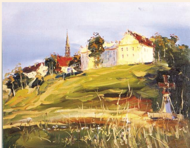
A. Jasin „Panorama Sandomierza”

Pochodzi z Ukrainy, ale za miejsce zamieszkania i pracy wybrał sobie malownicze okolice Sandomierza, które bardzo często stają się tematem obrazów. Jego ulubioną techniką jest akwarela, której ulotność, zwiewność i lekkość potrafi znakomicie wykorzystać. W pracach tych, przypominających dzieła impresjonistów jest wiele światła i żywych barw. Oddaje w nich prawdziwe bogactwo natury.