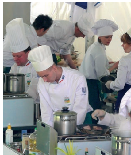
zmagania mistrzów kuchni

Podczas konferencji promowano również książkę kulinarną przygotowaną na prośbę wojewody. Zamieszczone w niej zostały najlepsze przepisy z regionu. Spis potraw zawiera ok. 30 dań z każdego zakątka województwa świętokrzyskiego.