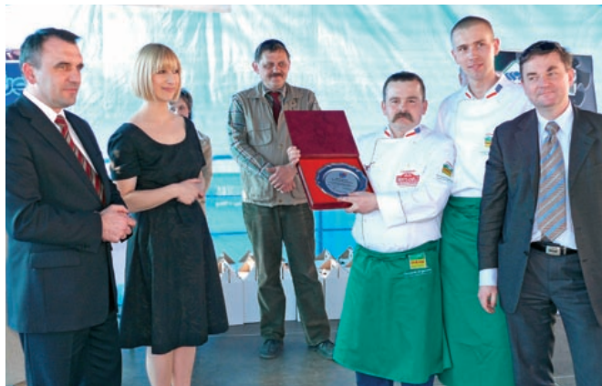
w konkursie kulinarnym zwyciężyła restauracja „Monte Carlo”

Impreza zorganizowana została z inicjatywy wojewody, wspólnie z marszałkiem województwa świętokrzyskiego. Pomysł zrodził się podczas ubiegłorocznej edycji konkursu wojewody „Świętokrzyska potrawa świąteczna”.