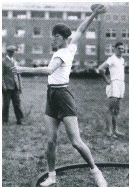
Halina Konopacka zdołała pierwszy złoty medal dla Polski podczas olimpiady w Amsterdamie w 1928 r.

Nowożytnie igrzyska olimpijskie datuje się dopiero na 1896 rok. Dwa lata przed tym wydarzeniem baron Pierre de Coubertin zwołał w Paryżu Kongres Olimpijski, podczas którego powołano do życia Międzynarodowy Komitet Olimpijski. Francuski arystokrata, człowiek światły i elokwentny wiele podróżował, również do Stanów Zjednoczonych. Wizytując amerykańskie uniwersytety Coubertin był szczególnie pod wrażeniem szerokiej gamy form aktywności sportowej organizowanej przez studentów. Był świadkiem szerokiej edukacyjnej roli, jaką sport odgrywa w życiu studentów. Pod wpływem tych doświadczeń Coubertin dostrzegł olbrzymie znaczenie sportu w procesie przygotowania młodych ludzi do podjęcia odpowiedzialnych obowiązków zawodowych.