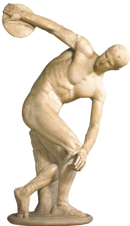
Dyskobol” – rzeźba Myrona z V w. p.n.e.

„W imieniu wszystkich zawodników ślubuję: respektować zasady obowiązujące w sporcie, przestrzegać zasady szlachetnej rywalizacji i zawsze postępować zgodnie z duchem fair play; wszystkie dążenia, umiejętności, talent i siły woli poświęcić osiągnięciu najlepszego wyniku sportowego” - przysięga olimpijska jest składana co dwa lata przez jednego przedstawiciela wszystkich zawodników od 1920. Słowa ukute przez francuskiego pedagoga, barona Pierre'a de Coubertin'a stanowią współcześnie kwintesencję rywalizacji sportowej w duchu fair play.