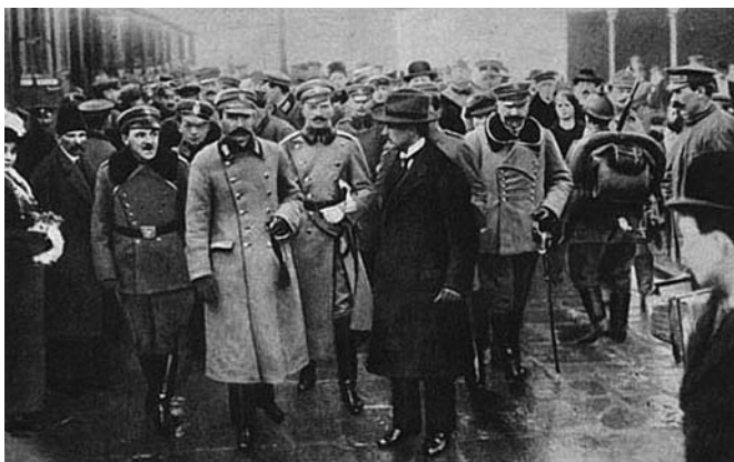
Powitanie Józefa Piłsudskiego po powrocie z Magdeburga

Dzień 11 listopada, dla uczczenia powstania suwerennego ośrodka władzy odrodzonej Polski, został w kwietniu 1937 roku oficjalnie ogłoszony świętem narodowym, choć dzień ten był już od 1919 roku obchodzony jako Święto Niepodległości. Ustawa sejmowa sprzed 71 lat głosiła: „Dzień 11 listopada, jako rocznica odzyskania przez Naród Polski niepodległego bytu państwowego i jako dzień po wsze czasy związany z imieniem Józefa Piłsudskiego, zwycięskiego Wodza Narodu w walkach o wolność Ojczyzny - jest Uroczystym Świętem Niepodległości”. Po II wojnie światowej władze komunistyczne świętem