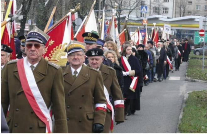
Kieleckie obchody Święta Niepodległości AD 2007

państwowym uczyniły dzień 22 lipca – datę podpisania Manifestu PKWN, jako Narodowe Święto Odrodzenia Polski. Narodowe Święto Niepodległości obchodzone 11 listopada przywrócono ustawą Sejmu z lutego 1989 roku.