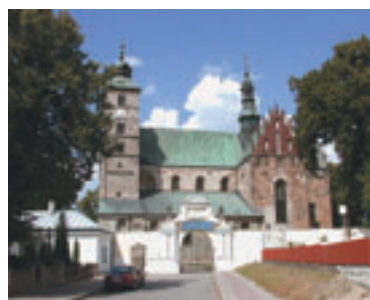
Kolegiata w Opatowie

W źródłach pisanych po raz pierwszy nazwa Opatowa pojawia się w 1189 roku. Najświetniejszy okres w dziejach Opatowa przypada na lata 1514–1532, kiedy to miasto stanowiło własność kanclerza Krzysztofa Szydłowieckiego. Wieki XVI i XVII to okres rozwoju miasta także jako ośrodka politycznego – tu odbywały się sejmiki szlachty województwa sandomierskiego.