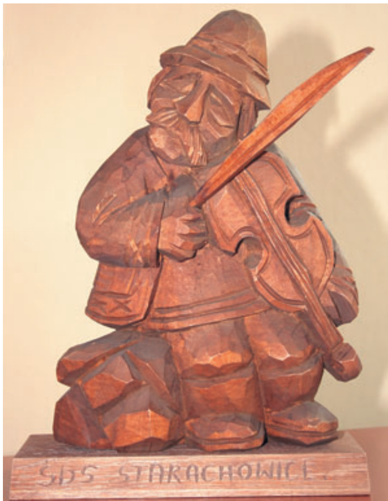
Rzeźba wykonana przez mieszkańców Środowiskowego Domu Samopomocy w Starachowicach