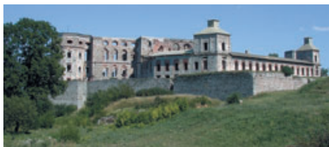
Ruiny zamku Krzyżtopór w Ujeździe

W 1619 r. posiadłości otrzymał od ojca Krzysztof Ossoliński. Wzbogaciwszy się na dostawach wojennych postanowił on zbudować siedzibę, która by swoim architektonicznym rozmachem zdominowała wszystkie pozostałe budowle ówczesnych magnatów.