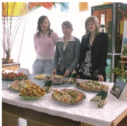
Stoisko gastronomiczne przygotowane przez uczestników 13-3 OHP Kielce