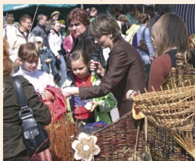
Ubiegłoroczne Dni Ziemi były dla kielczan dużą atrakcją