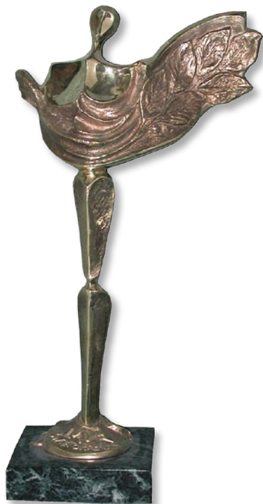
Statuetka Laura wykonana przez Sławomira Micka

Kolejne spotkanie kapituły odbyło się na początku marca. Podczas posiedzenia wyłoniono podkomisje odpowiedzialne za każdą kategorię Nagrody. Podczas obrad wytypowano czterech kandydatów do nagrody „Gmina Roku” oraz po pięciu kandydatów w pozostałych kategoriach. Podjęto również decyzje o przyznaniu „Laura Specjalnego”.