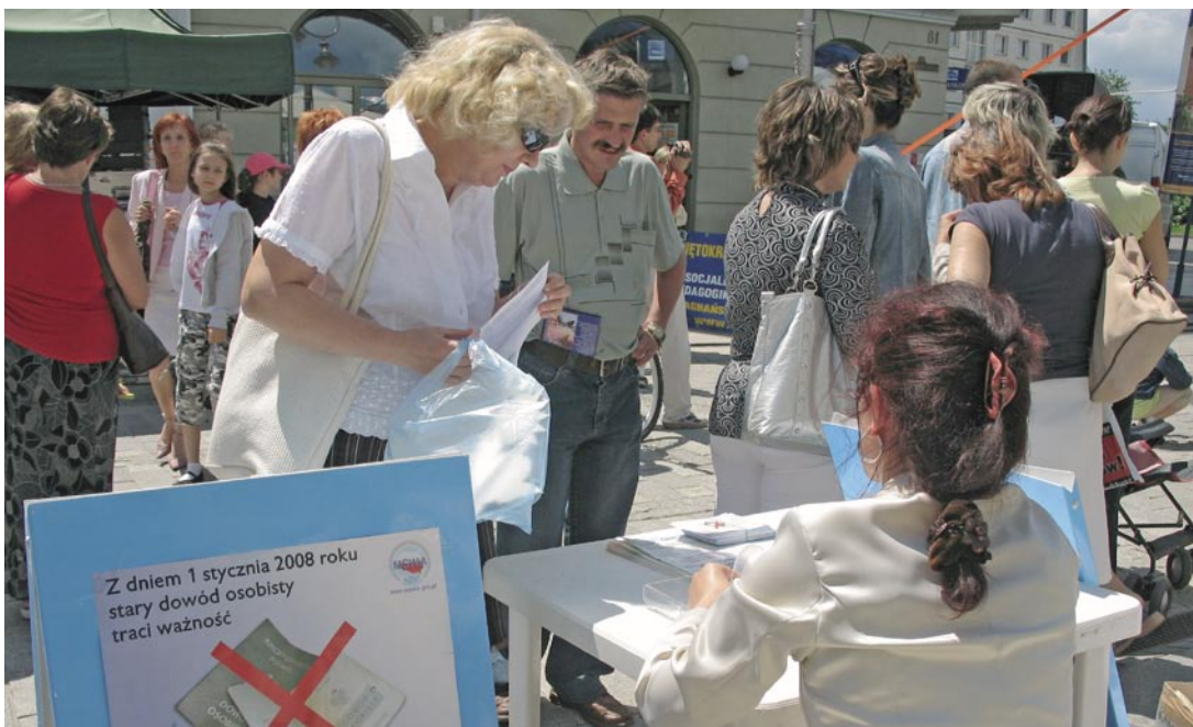
Urzędowe punkty informacyjne cieszą się dużym zainteresowaniem