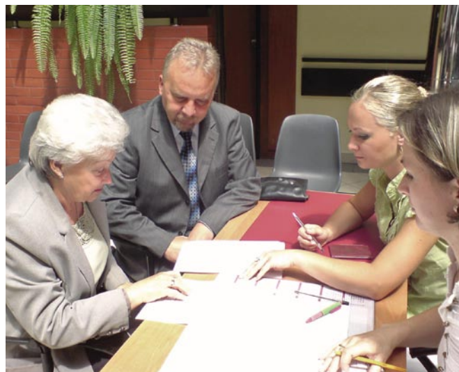
Wojewoda służył pomocą przy wypełnianiu wniosku

Każdy, kto nie wymieni starego dowodu osobistego do 31 grudnia 2007 r., po nowym roku będzie miał problemy z załatwieniem choćby najdrobniejszej sprawy wymagającej potwierdzenia danych. Przede wszystkim niemożliwe będzie załatwienie jakiegokolwiek formalności urzędowych czy notarialnych. Z kolejnymi utrudnieniami osoby te spotkają się na poczcie, bowiem bez nowego dowodu nie będzie można nawet odebrać przesyłki poleconej. Podobnie w przypadku rent i emerytur. Wszelkie świadczenia pieniąż-