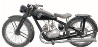
SHL 98 z kolekcji fabrycznej