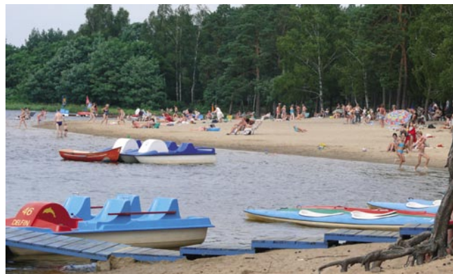
zalew w Sielpi – laureat III miejsca w konkursie

Statuetki zwycięzcom wojewoda wręczył 2 września podczas uroczystej gali przed Kieleckim Centrum Kultury. Podwójne uznanie zyskało kąpielisko w Sędziszowie, bowiem zdobyło również statuetkę od czytelników Gazety Wyborczej i Polskiego Radia Kielce, którzy oddali na nie najwięcej głosów. - Konkurs powstał z myślą o bezpieczeństwie wypoczywających nad wodą. Jego celem było podniesienie standardu kąpielisk. Bardzo się cieszę, że ich administratorzy tak ochoczo przystąpili do rywalizacji. Gratuluję zwycięzcom i mam nadzieję, że w przyszłym roku jeszcze bardziej uda się unowocześnić kąpieliska - mówił wojewoda.