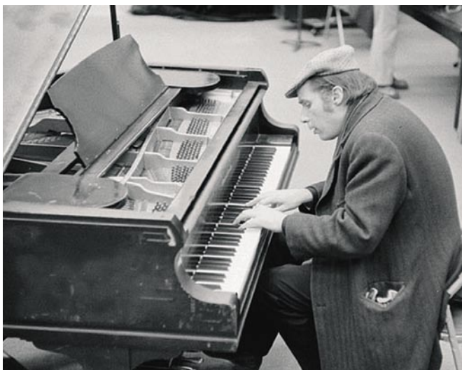
Glenn Gould w 1974 roku

Określany był jako „meteor, który przelatuje raz na stulecie”. Genialny pianista, wyjątkowo ciekawa postać, jeden z najznakomitszych odtwórców dzieł Jana Sebastiana Bacha. Glenn Gould – bo o nim mowa – sam tak do końca za pianistę się nie uważał. Mówił, że jest „kanadyjskim pisarzem, kompozytorem i człowiekiem mediów, który w chwilach zatracenia grywa na fortepianie”. Muzyczny świat został zaskoczony decyzją, którą Gould podjął w 1964 roku, będąc u szczytu sławy. W 32. roku życia definitywnie zerwał z publicznym koncertowaniem, poświęcając się pracy w studio i nagrywaniu płyt.