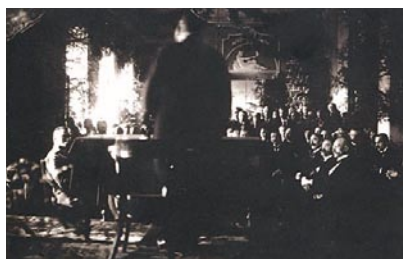
Uroczystość nadania Józefowi Piłsudskiemu honorowego obywatelstwa Kielc