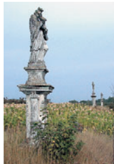
Barokowe figury w okolicy Młodzaw.

Podróżując po Ponidziu, niemal w każdej miejscowości lub jej najbliższej okolicy znajdziemy te świadectwa naszej wiary i tradycji.