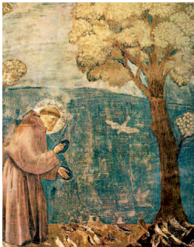
Św. Franciszek - kazanie do ptaków (fragm. fresku Giotta)

Kto jest okrutny w stosunku do zwierząt, ten nie może być dobrym człowiekiem – kto by przypuszczał, że słowa niemieckiego filozofa, Artura Schopenhauera, będą tak uniwersalne i współcześnie prawdziwe? Problem humanitarnego traktowania zwierząt rozrósł się w ostatnim czasie do rozmiarów przerażających. Odrąbana siekierą