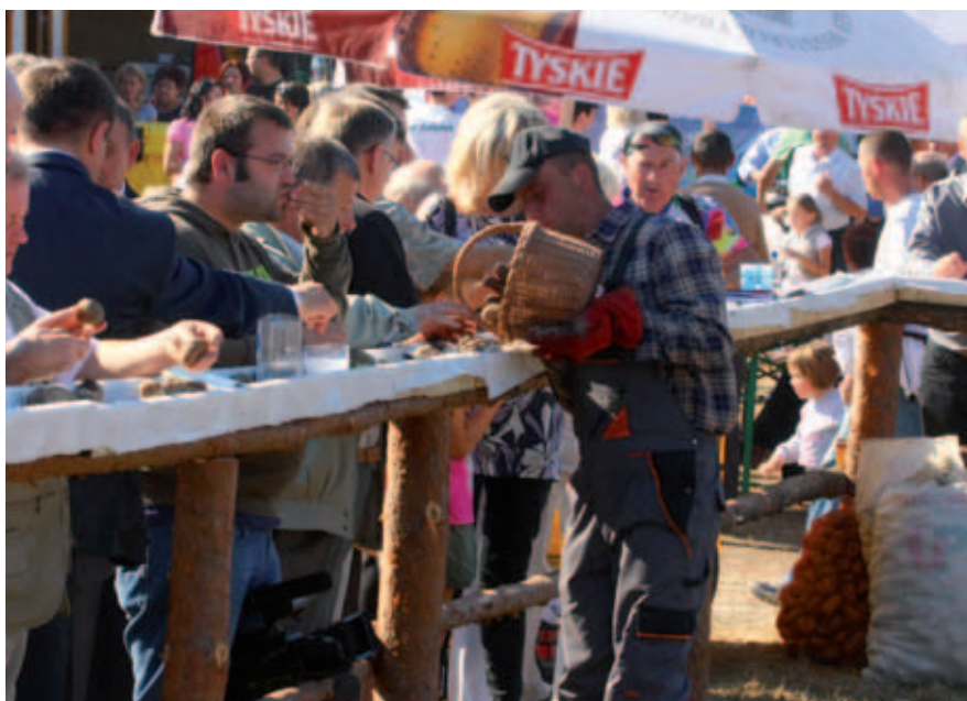
Ziemniaki zawsze cieszą się powodzeniem (Dębno)

co w momencie zarazy ziemniaczanej przyczyniło się do śmierci głodowej wielu mieszkańców Europy. Zapomniano o poczciwych kaszach, zapomniano jak się je uprawia i przyrządza. Równocześnie zabrakło ziemniaka, który był podstawą każdej kuchni. Brak pożywienia i widmo śmierci głodowej stały się przyczyną jednej z największych emigracji do Ameryki Północnej. Innymi słowy ziemniak przegnał swojego wielbiciela tam, skąd sam pochodził – wspominał z uśmiechem nieodżałowany Maciej Kuroń.