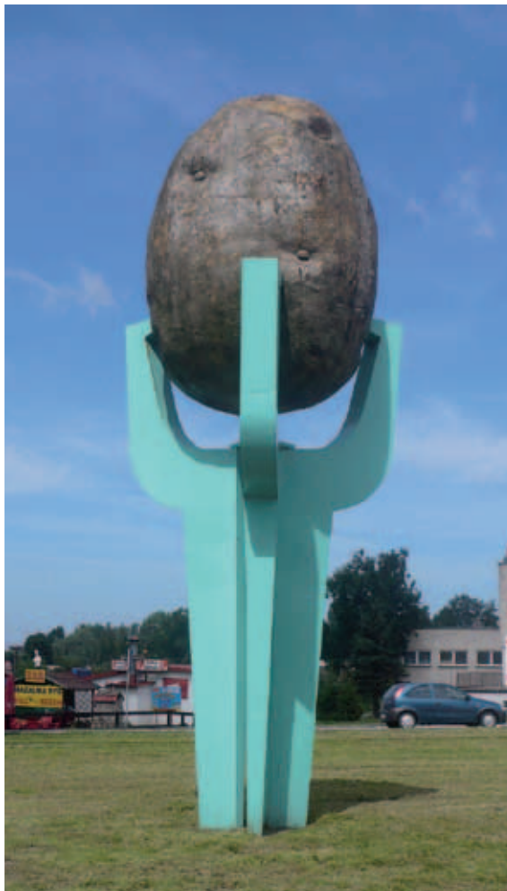
Pomnik Ziemniaka w Besiekierzu

Milowym krokiem ziemniaka podróży do Euro-