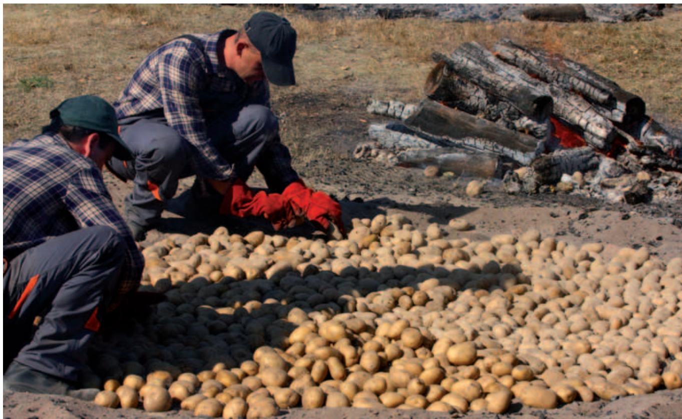
Przygotowanie do pieczenia ziemniaków (Dębno)

i Poznaniu, W Chorwacji, Austrii, Stanach Zjednoczonych czy Słowacji. - To z miłości nadawano mu tyle nazw, nazywano nie tylko ziemniaka, jako takiego, ale również poszczególne jego odmiany: błyszczce, szulce, laloszki, lipcówki i całe zastępy potraw: rejbaki, ciszki, pampuchy, copy, stryki, łąźnie, czy kugle. Z jednej więc strony zniwelował głód, z drugiej „wyciął” z naszego jadłospisu kasze,