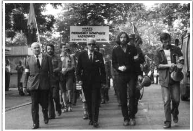
Pierwszy powojenny Marsz Szlakiem Kadrowki.

1932, 8 lipca: Władysław Wagner wypłynął z Gdyni na jacht „Zjawa” w swą słynną podróż. Ów 19-letni wówczas harcerz, zafascynowany morzem i morskimi przygodami, pochodził z Krzyżowej Woli koło Starachowic. Zapragnął zdobyć świat. I swoje marzenie spełnił: jako pierwszy w dziejach Polak okrążył jachtem żaglo-