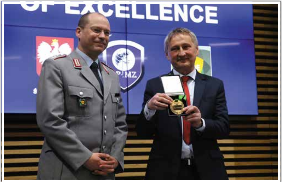
Wręczenie CIMIC Award of Excellence.

Do Polski, od momentu wybuchu wojny, przyjechało prawie tysiąc dzieci chorych onkologicznie. Do województwa świętokrzyskiego trafiło blisko 600 małych pacjentów. Z czego ponad 200 dzieci zostało objętych leczeniem w Polsce, pozostałe zostały przekierowane