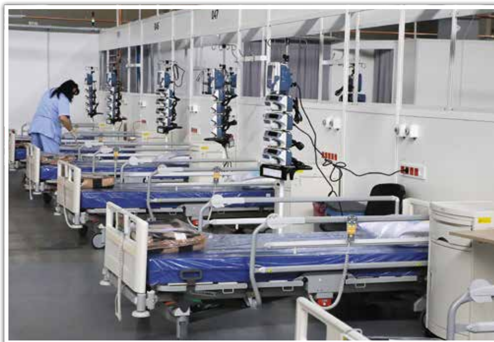
Świętokrzyski Szpital Tymczasowy.

Kielce, pierwszych pacjentów przyjęto w marcu 2021 r. Podmiotem merytorycznie odpowiedzialnym za działalność placówki był Wojewódzki Szpital Zespolony w Kielcach. Przygotowano 300 miejsc dla pacjentów, w tym około 50 miejsc respiratorowych, czyli przeznaczonych do leczenia ciężkich przypadków. Szpital zakończył swą działalność z końcem maja 2021 r. „Mam ogromną nadzieję, że będzie to także symbol końca epidemii i początku powrotu do normalności. Dziękuję wszystkim, którzy byli zaangażowani w pracę przy jego powstawaniu oraz w trakcie jego funkcjonowania. Wasza chęć niesienia pomocy w tymże szpitalu była ogromna, dlatego dziękuję również tym, którzy aplikowali do pracy i wyrazili chęć zaangażowania się w ten projekt. Był to ciężki czas, dlatego cieszę się, że potrafiłmy wspólnie podjąć to trudne wyzwanie i, mimo wielu trudów i niełatwych chwil, potrafiłmy na pierwszym miejscu postawić sobie cel niesienia pomocy” – napisał wojewoda w liście skierowanym do wszystkich osób zaangażowanych w pracę szpitala tymczasowego.