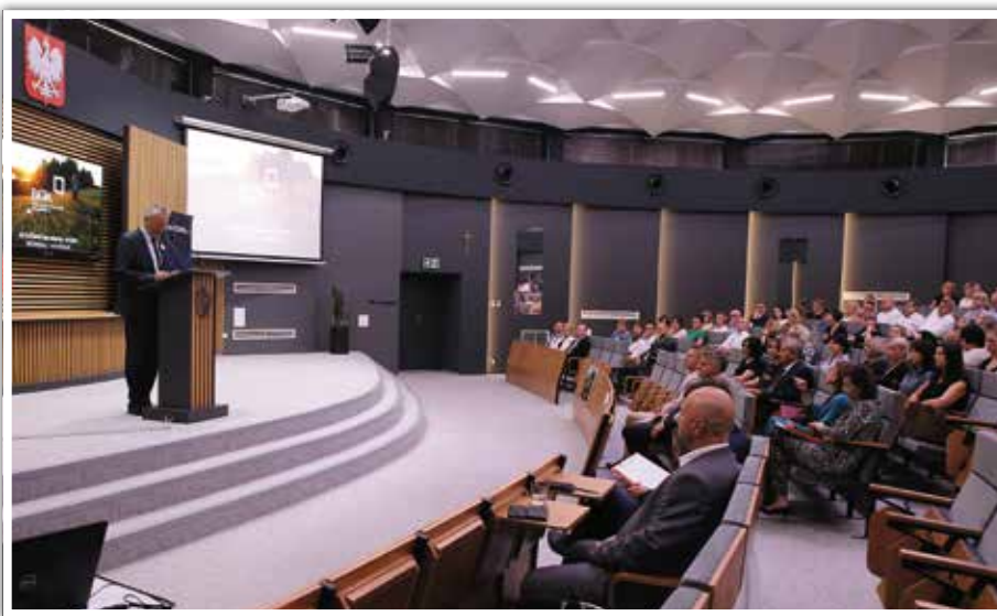
Konferencja ze świętokrzyskimi samorządowcami.

Program rozwoju instytucji opieki nad dziećmi w wieku do lat 3 „Maluch+” to program prorodzinny, wspierający powstawanie i funkcjonowanie miejsc opieki nad najmłodszymi dziećmi. Jego głównym celem jest zwiększenie dostępności miejsc opieki w żłobkach, klubach dziecięcych i u dziennych opiekunów dla wszyst-